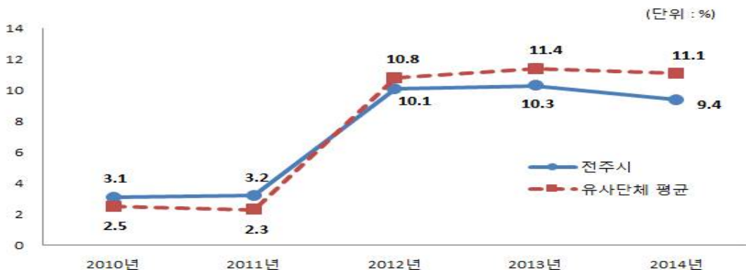
지방보조금 비율 유사 지방자치단체와 비교

※ '11 ~ '14년도 지방보조금(민간) 자료는 각 회계연도 결산서를 기준으로 작성