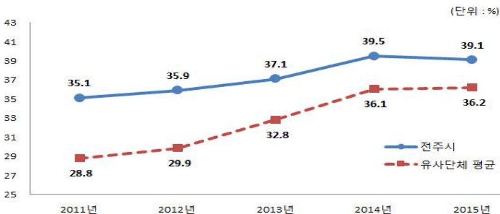
유사 지방자치단체와 사회복지비 비율 비교

☞ 세출분야 중 사회복지비가 39.1%로 차지하는 비중이 높은 것으로 나타났으며, 향후 사회복지 정책 확대에 따라 사회복지비 비중은 지속적으로 증가할 것으로 전망됨.